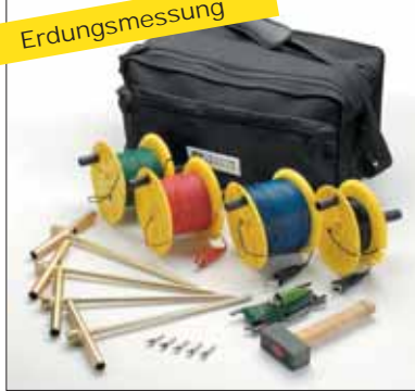
Zubehör-Set für Erdungs- und Erdwiderstandsmessung P01.1020.25 Ein kompletter Satz mit sämtlichem Zubehör für die Messung von Erdungs- und Erdwiderständen Siehe S.51