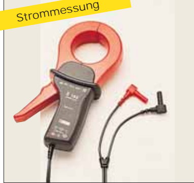
Zangenstromwandler für direkte AC- und DC-Strommessungen von 0,1 mA bis 3600 A an Anlagen im Betrieb, ohne Stromkreisunterbrechung. Siehe S.29