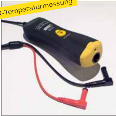
Infrarot-Sonde C.A 1871 P01651610Z Macht aus Ihrem Multimeter ein Digital-Infrarot-Thermometer Siehe S.90