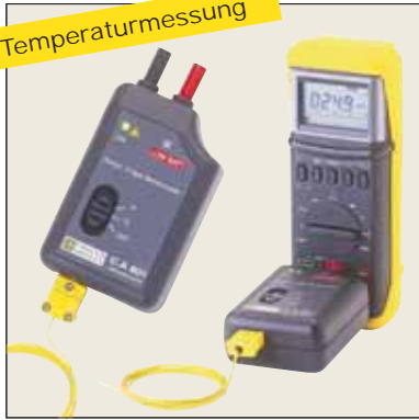
Temperaturmessadapter C.A 801 P01652401Z Temperaturmessadapter C.A 803 (2 Kanäle mit Differenzmessung) P01652411Z Verwandeln Ihr Digitalmultimeter in ein Thermometer Siehe S.89