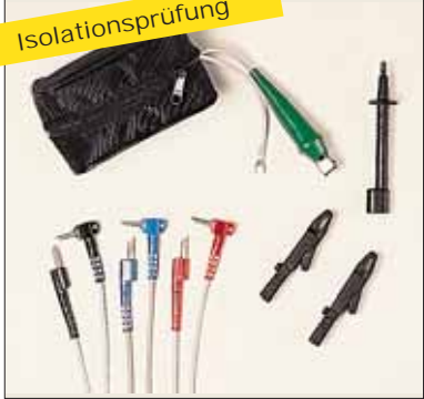
Zubehörtasche IPA 2 P01101901 Ein vollständiger Satz Sicherheitszubehör für Isolationsmessungen mit den Isolationsprüfern der Serie IMEG Siehe S.46-47