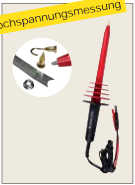
Hochspannungstastkopf SHT 40 kV für Multimeter P01102097 • Maximale zulässige Spannung: 40 kV DC , 28 kV eff bzw. 40 kV Spitze (50/60 Hz) • Wandlerverhältnis (Eingang / Ausgang): 1 kV/1 V • Für Multimeter mit Eingangsimpedanz von 10 M \Omega