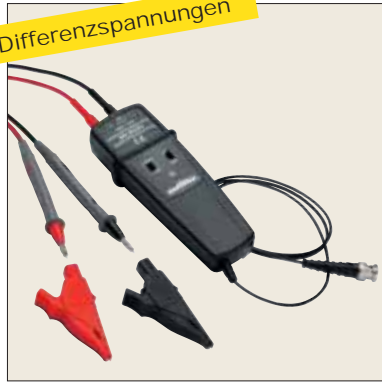
Differenzspannungssonde MX 9030 MX 9030-Z gem. IEC 61010-1, Cat. IV-2 Ermöglicht die Anzeige von hohen Differenzspannungen bis \pm 600 V auf einem Oszilloskop bei voller Sicherheit. Bandbreite: 30 MHz Siehe S.113