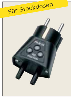
C.A 751 Adapter zur Messung an Schuko-Steckdosen P01101997Z Erkennung Phase / Neutralleiter Einsetzbar mit Multimeter mit Prüfspitzen mit 4 mm \varnothing oder mit Spannungsprüfer C.A 704 und C.A 760 (Siehe S.11)