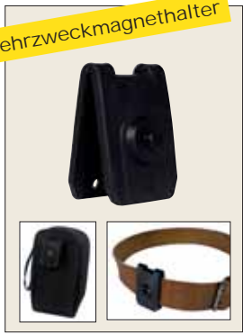
Mehrzweckmagnethalter Multifix P01102100Z • Für geeignete Messgeräte und Zubehör (Multimeter, Transporttaschen...) • Bestes Komfort beim Einsatz und Transport