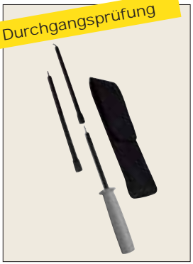
Messstab für Durchgangsprüfung P01102084A • Isolierte Busche mit 4 mm \varnothing • Länge 90 cm (3 x 30 cm) • Schutz: 1000 V max.