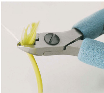
Kommunikation Glasfaserkabel, Kevlar® - Anwendungen

Zum Schneiden von mit Vectran® ummantelten Drähten oder kleinen Litzen aus rostfreiem Stahl