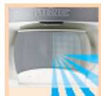
Reduzierung des Erfassungswinkels