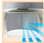
Reduzierung des Erfassungswinkels