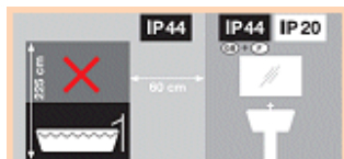
Schutzzonen im Bad