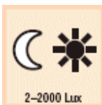
2–2000 Lux Dämmerungseinstellung