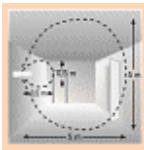
Erfassungsbereich bei Wandmontage