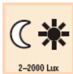
Dämmerungseinstellung 2–2000 Lux