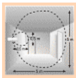
Erfassungsbereich bei Wandmontage