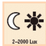
2–2000 Lux Dämmerungseinstellung