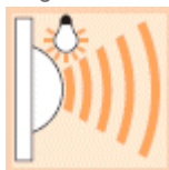
HF-Sensor HF 360 UP