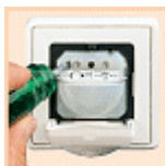
IR 180 UP: Dämmerungs- und Zeiteinstellung