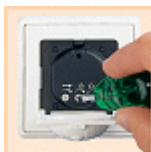
HF 360 UP: Reichweiten-, Dämmerungs- und Zeiteinstellung